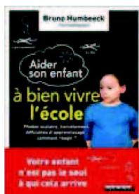
« Aider son enfant à bien vivre l'école », éd. Leduc, 272 p., 18 euros.