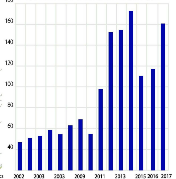
1 161 LICENCES VENDUES DEPUIS 2002