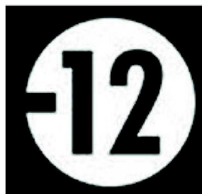
» Déconseillé aux moins de 12 ans

▶ On applique cette signalétique aux films et/ou programmes "comportant des scènes susceptibles de nuire à l'épanouissement physique, mental et moral de l'enfant".