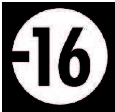
» Déconseillé aux moins de 16 ans

▶ Ces films comportent des scènes qui peuvent nuire à l'épanouissement de l'enfant, dont des scènes de violence physique ou psychologique répétées. Ils sont diffusés au-delà de 20 h.