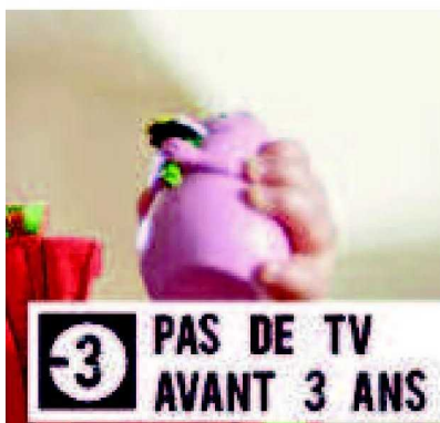
» Avertissement moins de 3 ans

▶ Sur certaines chaînes comme BabyTV ou Disney Junior, un avertissement apparaît pour mettre en garde de la nocivité de l'exposition à la TV au moins de 3 ans.