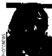
ELIO DI RUPO Président du PS, député fédéral et bourgmestre.