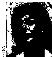
JOËLLE MILQUET Députée bruxelloise CDH et conseillère communale.