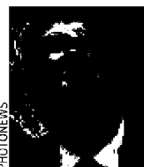
RENÉ COLLIN CDH, ministre wallon de l'Agriculture.