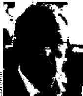
MURIEL TARGNION Bourgmestre depuis octobre 2015, députée PS à la Communauté française.