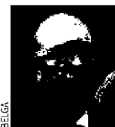
RUDY DEMOTTE PS, ministre- président de la Communauté française, bourgmestre en titre.