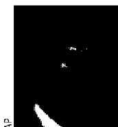
YVAN MAYEUR Bourgmestre PS.