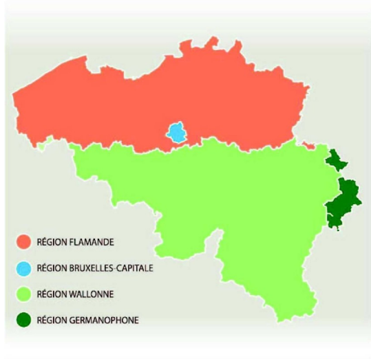
La Belgique des quatre Régions