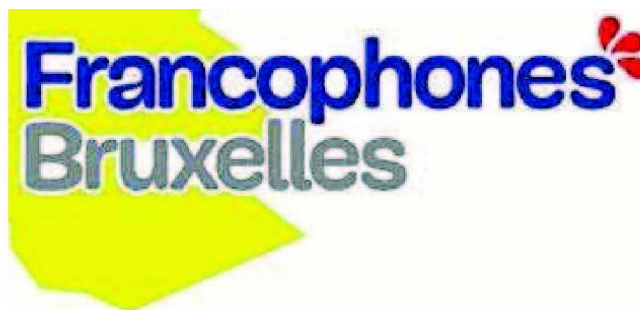
■ Le nouveau logo.