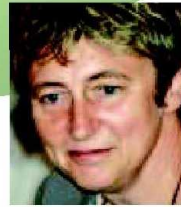
Marie-Ange Cornet © D.R.

Comme c'est encore illégal, ils ne se déclarent pas à ce stade. Je pense que certains producteurs seront intéressés par ce marché. Personne ne fait plus de l'alcool de manière artisanale parce que le produit est disponible. De même, on pourrait ainsi assister à l'assèchement de la filière illégale du cannabis. Toute société a recours à la drogue. On peut croire qu'en l'interdisant, on l'efface, mais c'est un leurre, cela ne fonctionne pas. Et le trafic autour du produit induit de nombreuses conséquences négatives pour la société.