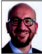
➔ 4 e (4 e ) Charles Michel MR 17% (+2 pts)