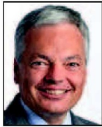
➔ 3 e (3 e ) Didier Reynders MR 19% (+1 pt)