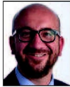
➔ 4 e (4 e ) Charles Michel MR 23% (+3 pts)