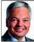
➔ 3 e (3 e ) Didier Reynders MR 28% (+1 pt)