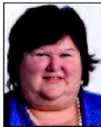
➔ 1 er (1 er ) Maggie De Block Open VLD 36% (+2 pts)