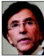
➔ 2 e (2 e ) Elio Di Rupo PS 29% (+1 pt)