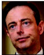
➔ 2 e (2 e ) Bart De Wever N-VA 31% (=)