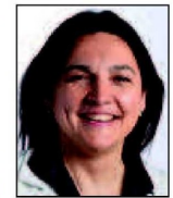
➔ 12 e (11 e ) Marie-Christine Marghem MR 11% (=)