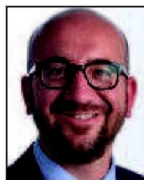
➔ 10 e (17 e ) Charles Michel MR 15% (+4 pts)