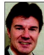
➔ 19 e (22 e ) Sven Gatz Open VLD 9% (=)