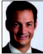
➔ 4 e (4 e ) Alexander De Croo Open VLD 18% (=)