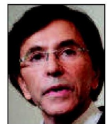
➔ 20 e (20 e ) Elio Di Rupo PS 9% (=)