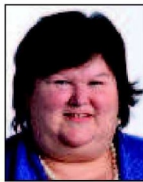
➔ 2 e (2 e ) Maggie De Block Open VLD 31% (+3 pts)