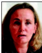
➔ 5 e (5 e ) Liesbeth Homans N-VA 17% (=)