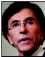
➔ 1 er (1 er ) Elio Di Rupo PS 39% (=)