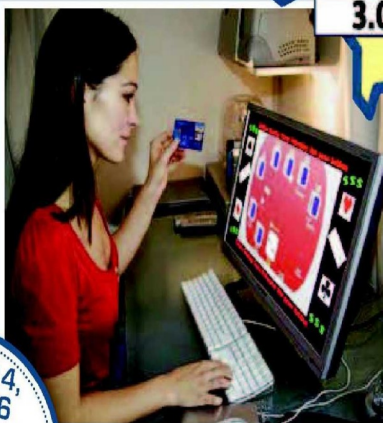
Jeux de hasard sur le web: attention, danger.

ne sont pas nécessairement des joueurs; ils n'en restent pas moins interdits de jeu. Deuxième catégorie en nombre: des personnes qui font l'objet d'une décision d'un juge de paix. On trouve 95.481 Belges dans ce cas. Il s'agit de personnes vulnérables. « C'est une tranche de gens qui ont été condamnés ou qui ont eu de graves problèmes de dépression, ou de personnes âgées placées sous administration provisoire », explique M. Marique. Cette catégorie regroupe essentiellement des personnes âgées. Des personnes qui, sans ces me-