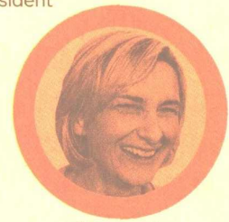
Hilde Crevits Enseignement