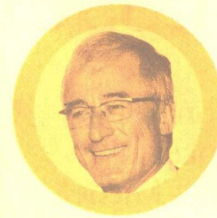
Geert Bourgeois Ministre-président