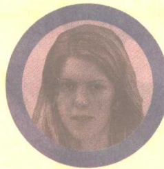
Els Ampe Culture et Médias