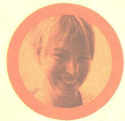
Joke Schauvliege Agriculture, Environnement et Aménagement du territoire