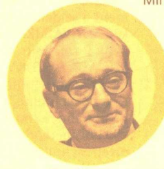
Ben Weyts Mobilité, Travaux publics et Périphérie bruxelloise