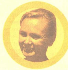
Liesbeth Homans Affaires intérieures, Logement et Lutte contre la pauvreté